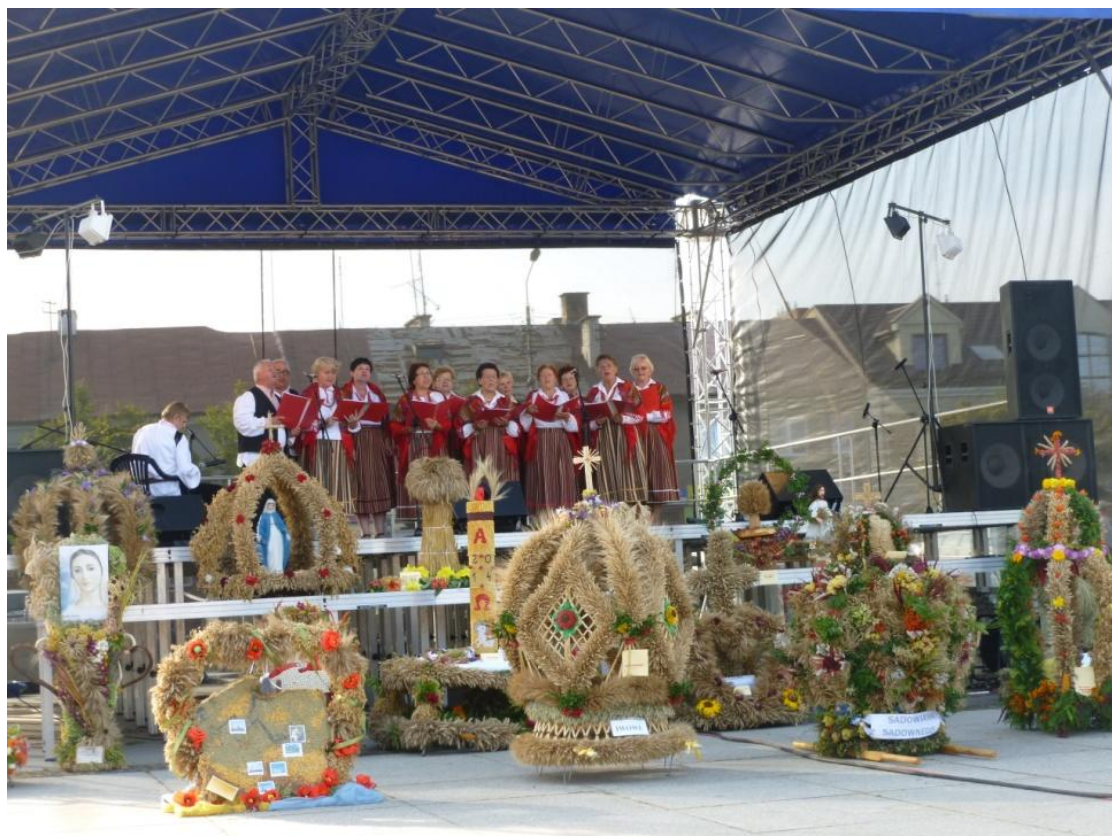
SADOWIANKI na scenie.

Po występach pojawiła się wzmianka na temat zespołu zamieszczona na info Sadowne :