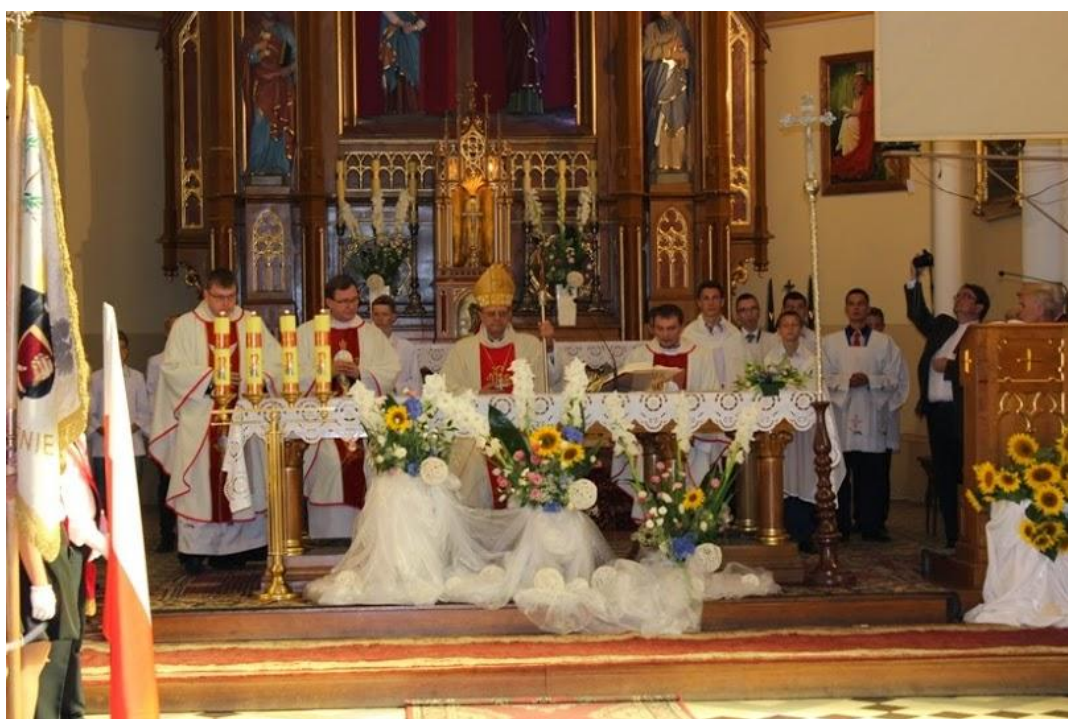
W kościele Biskup Ordynariusz Tadeusz Pikus odprawił mszę w intencji zmarłych i żyjących mieszkańców Sadownego.