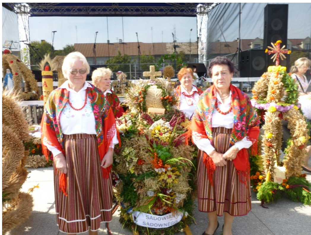
SADOWIANKI z wieńcem na Rynku Mariackim w Węgrowie.