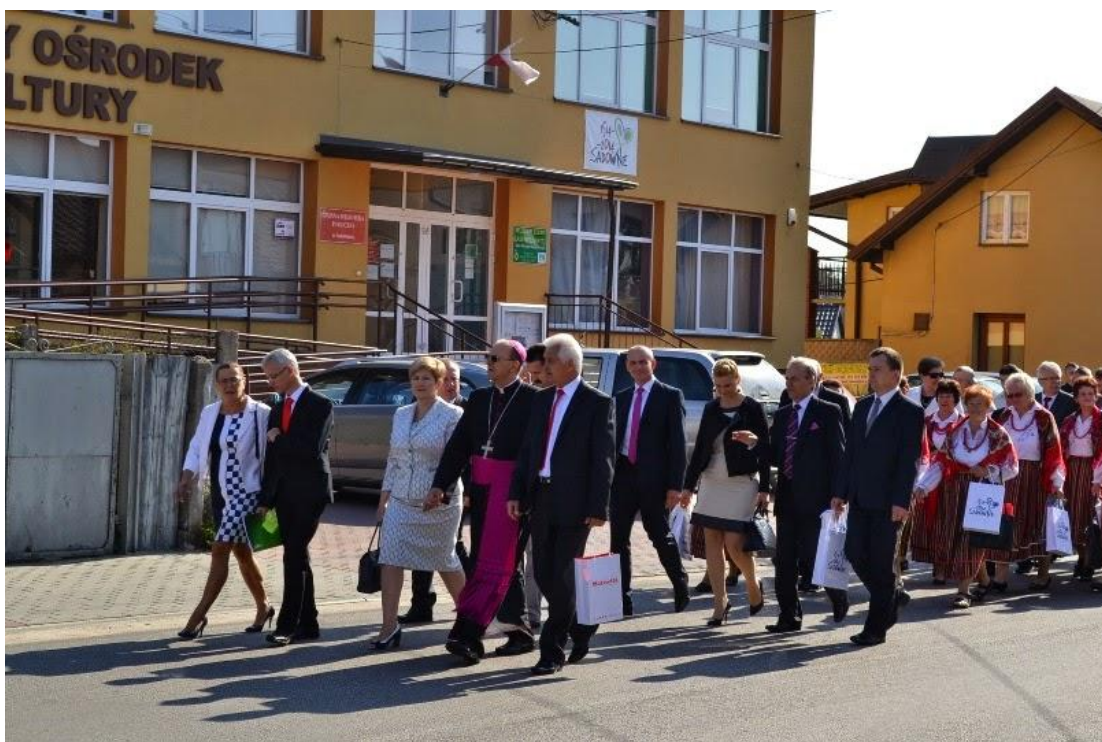
Po zakończeniu Sesji barwny pochód z Młodzieżową Orkiestrą Dętą z Tuszczu na czele ruszył w stronę kościoła.