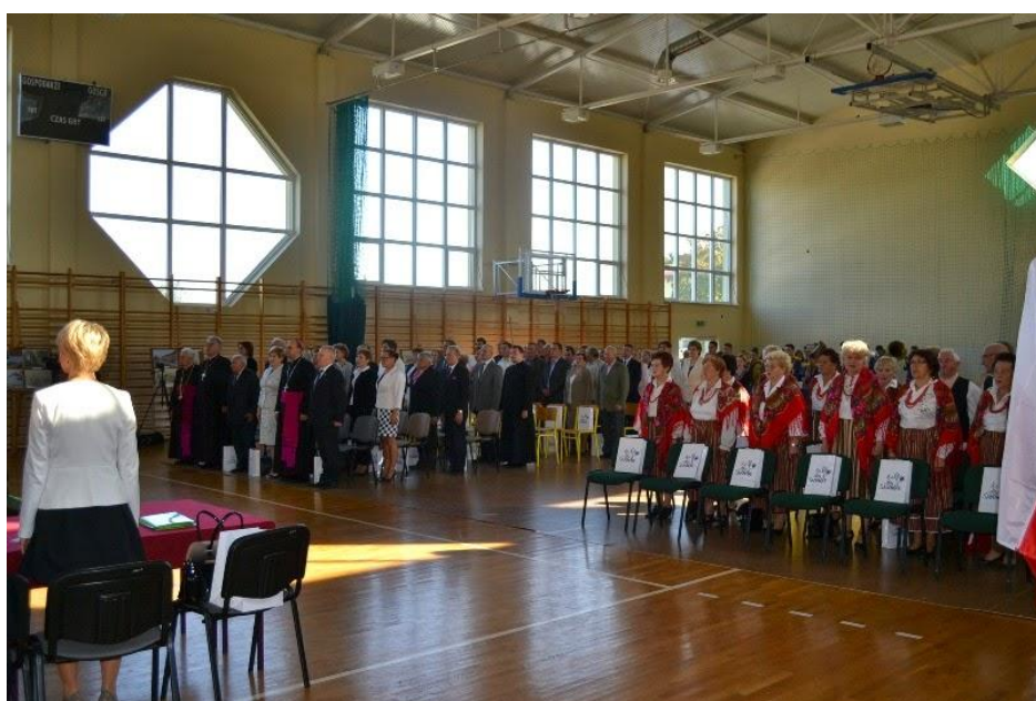
Wprowadzenie pocztów sztandarowych

Wczesnym przedpołudniem, bo już o godz. 9.00 hala sportowa przy sadowieńskim Gimnazjum zamieniła się w salę konferencyjną. Organizatorzy obchodów 500-lecia Sadownego, których tym razem reprezentowali: Wójt i Rada Gminy Sadowne, Parafia św. Jana Chrzciciela w Sadownem i Zespół Szkół Ponadgimnazjalnych, postanowili wykorzystać obiekt sportowy do zorganizowania uroczystej Sesji Rady Gminy Sadowne. Obiekt ten spełnia wszelkie normy na przyjęcie licznej rzeszy gości, a wśród przybyłych znaleźli się przedstawiciele polskiego Parlamentu, Samorządu Województwa Mazowieckiego, Powiatu Węgrowskiego i oczywiście Gminy Sadowne. Goście mieli też okazję obejrzyć przygotowaną w hali wystawę zdjęć na temat historii i współczesności Sadownego.