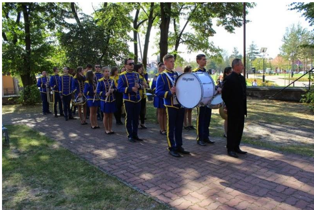
Młodzieżowa Orkiestra Dęta z Tłuszcza.