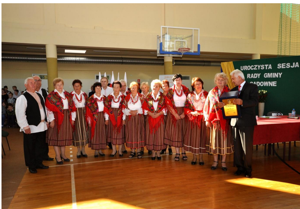
Wręczenie dyplomu: „Zasłużony dla Gminy Sadowne”.